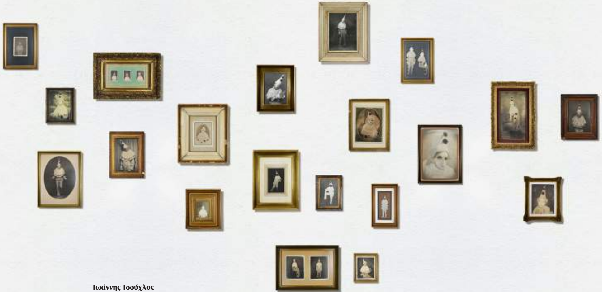
Ιωάννης Τσούχλος Το λευκό κοστούμι , 2022 ψηφιακές φωτογραφίες σε κορνίζα διαστάσεις μεταβλητές